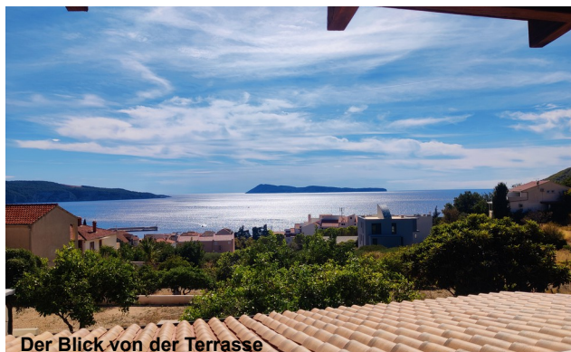
Der Blick von der Terrasse

Die Apartmenthäuser Bako und Picasso bieten mehrere 1-2 Zimmer Apartments rund um eine zentrale Terrasse mit traumhaftem Blick über den Ort und die gesamte Bucht. Die Entfernung zur Tauchbasis und Ortszentrum sind etwa 5 Gehminuten. Die Apartments sind als Selbstversorger geführt, es hat sich in den vergangenen Jahren bewährt, Frühstück gemeinsam einzukaufen und fürs Abendessen entweder gemeinsam zu Grillen oder im hübschen Hafen von Komiza Essen zu gehen.